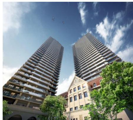
（仮称）宝塚ホテル跡地計画 パース

URL： https://www.hhp.co.jp/data/pdf/2_4w011e2gb6yo0kcswk0gs8o4.pdf